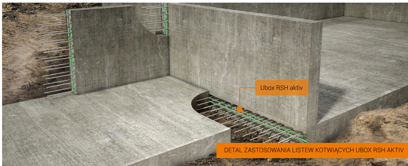
DETAL ZASTOSOWANIA LISTEW KOTWIĄCYCH UBOX RSH AKTIV